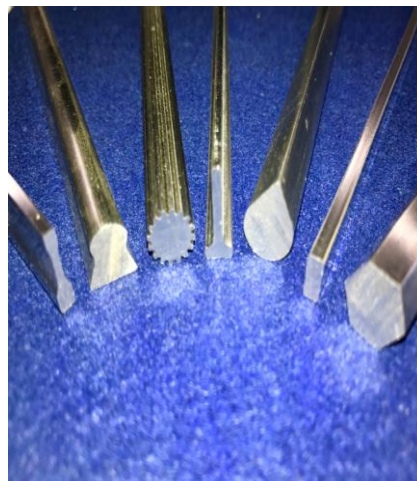
当社製品(ステンレス异形線)