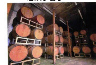
ワイン醸造の様子