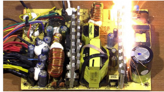
図5 浸水による通電火災のイメージ

(水に濡れた電気製品の内部には、水分が残っていたり、泥や塩分などの異物が付着していたりすることがあるため、通電時に電気回路基板から発火するおそれがある。)