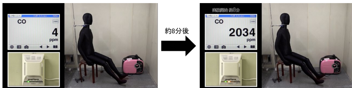
図2 室内で携帯発電機を使用した際の一酸化炭素（CO）濃度の変化