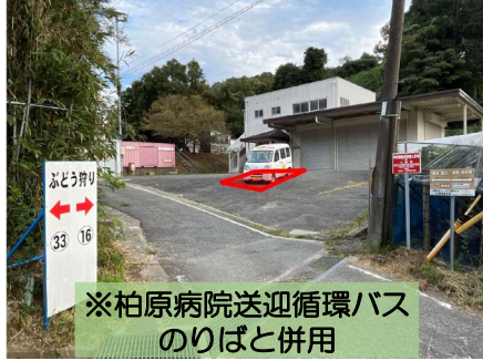
※柏原病院送迎循環バスのりばと併用