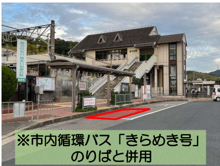
※市内循環バス「きらめき号」のりばと併用