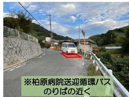
※柏原病院送迎循環バスのりばの近く