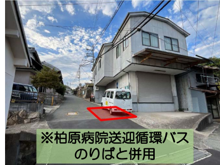
※柏原病院送迎循環バスのりばと併用