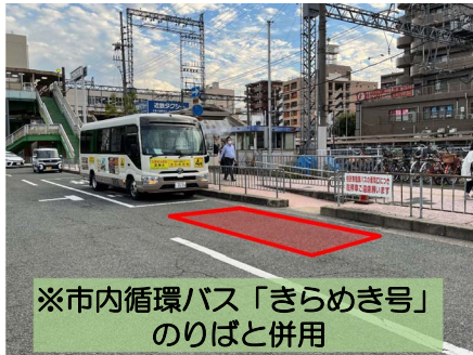
※市内循環バス「きらめき号」のりばと併用