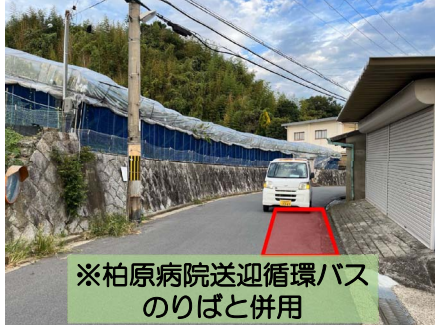
※柏原病院送迎循環バスのりばと併用