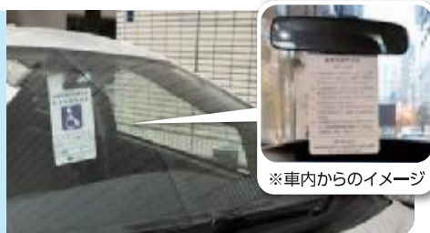
※車内からのイメージ

利用証は駐車する時、 ルームミラーにかける など、外から見えるよう に掲示してください。