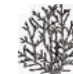
市の木「このてがしわ」