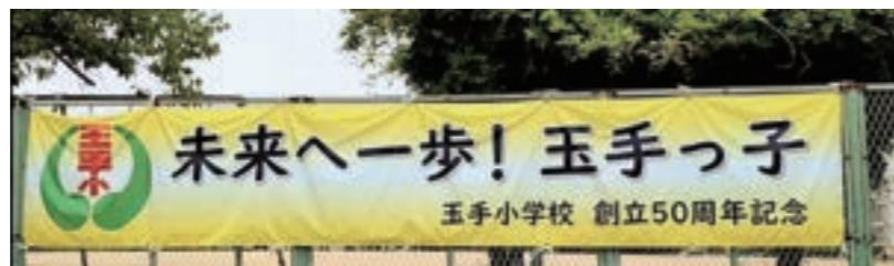
創立50周年記念フェスタ