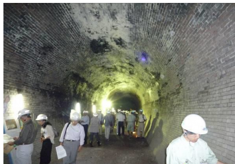
【旧国鉄関西線 亀の瀬トンネル見学の様子】