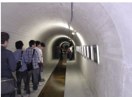
【排水トンネル見学の様子】