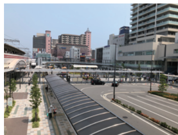
駅前広場の計画・整備(明石市)