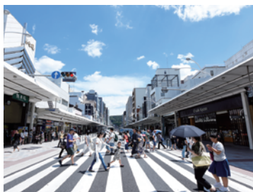
四条通歩道拡幅(京都市)