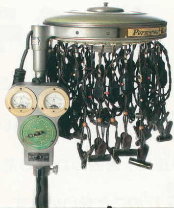
なんかいっぱいいてる