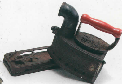
なんにつかったのかな?