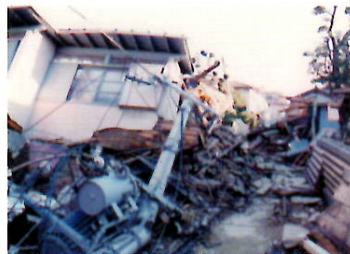
提供元「人と防災未来センター」