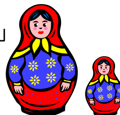
◆マトリョーシカ人形◆