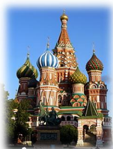
モスクワ、赤の広場 「聖ワシリイ大聖堂」