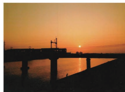
「今も変わらない夕陽百景」 作者 間下尚彦 (八尾市)