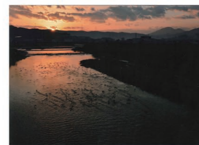
「旅立の朝」 作者 水戸泰朝 (玉手町)