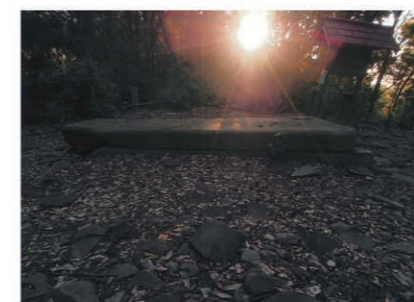
「松岳山古墳石棺を照らす」 作者 荒谷謙 (大和郡山市)