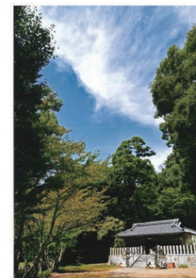
「金山彦神社と不死鳥雲」 作者 金岡明光 (門真市)