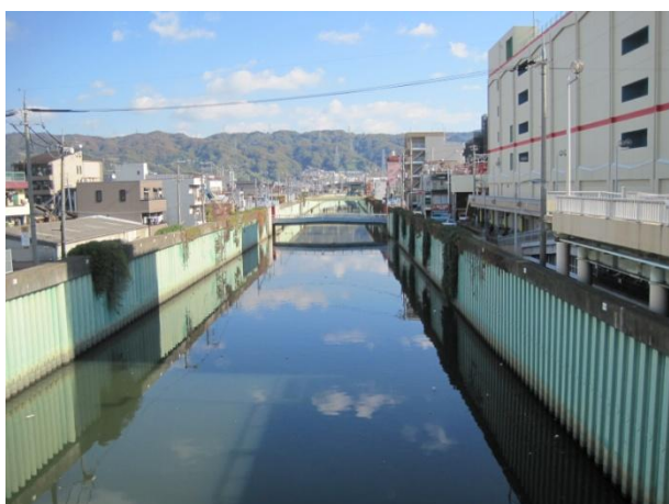
寝屋川合流直前の恩智川