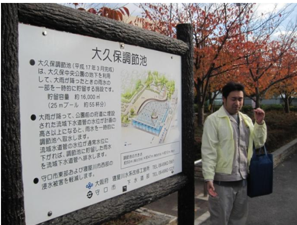
大久保調節池の上部の公園で説明