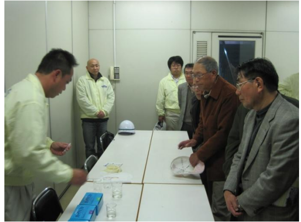
室内にて、治水、下水処理の流れについて