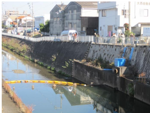
八尾市垣内南付近 ごみ浮遊啓発装置