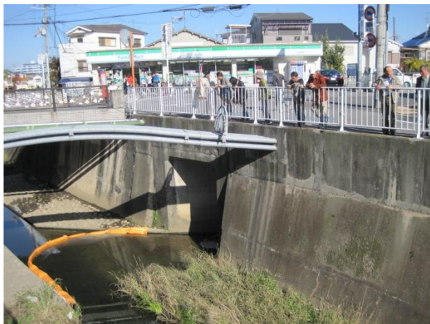
柏原市法善寺橋付近 ごみ浮遊啓発装置