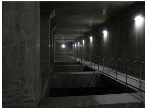
大久保調節池の内部

今年の研修会は、寝屋川流域協議会施設見学会に参加しました。場所は、守口市の終末処理場と大久保調節池でした。守口市終末処理場では、市の人口の約半分にあたる7万人の雑排水を処理しています。その後、大久保調節池は、洪水時等に一時的に雨水を貯留する調節池を見学しました。