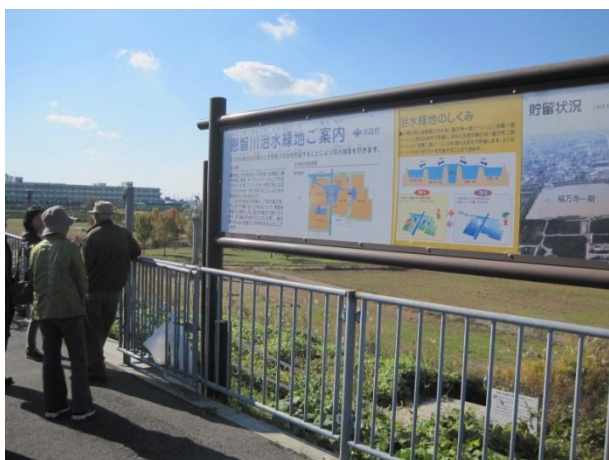
池島・福万寺恩智川治水緑地公園